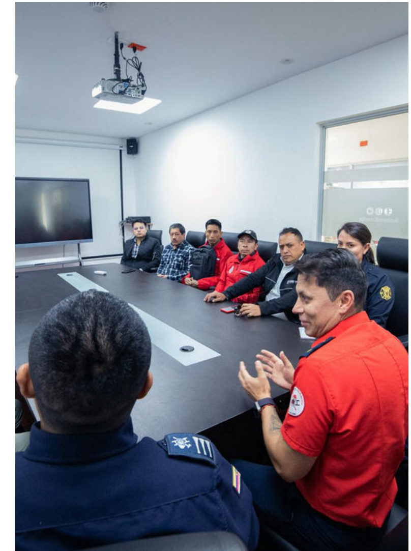
CUERPO DE BOMBEROS RIOBAMBA