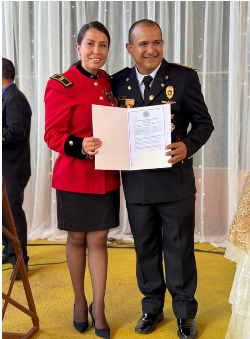
CUERPO DE BOMBEROS PORTOVELO