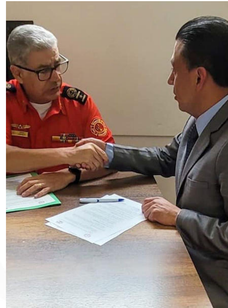
CUERPO DE BOMBEROS SANTA ISABEL