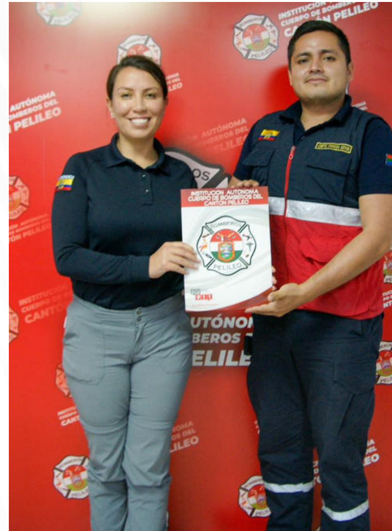
CUERPO DE BOMBEROS ARAJUNO